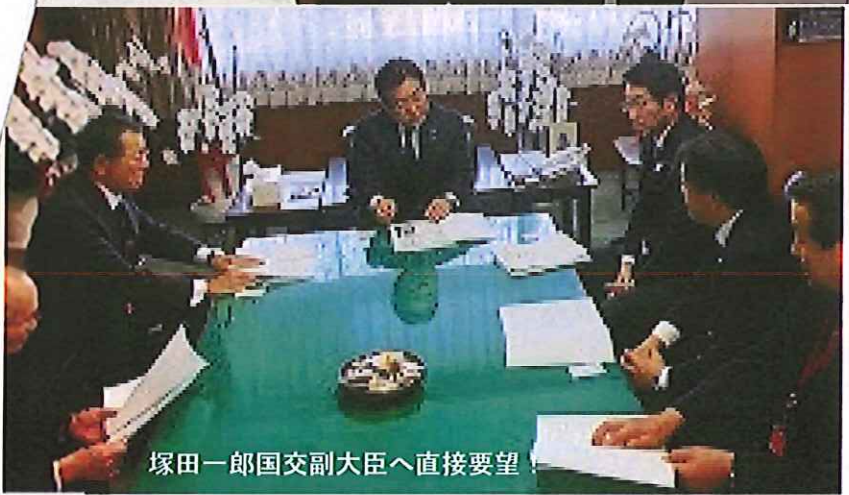
塚田一郎国交副大臣へ直接要望