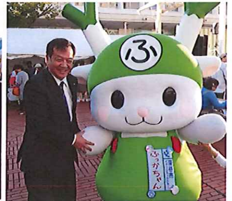
全国ねぎサミットが新潟市で開催されました。こんな企画いいですね。